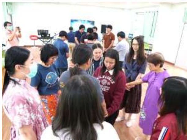
散學禮——為神學生祈禱