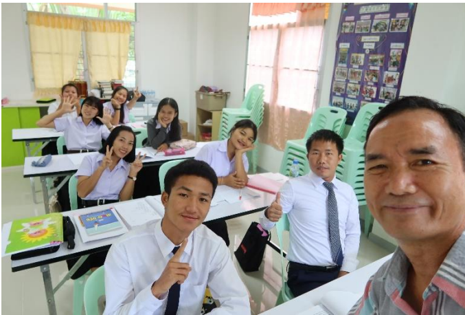
一年級學士生上課