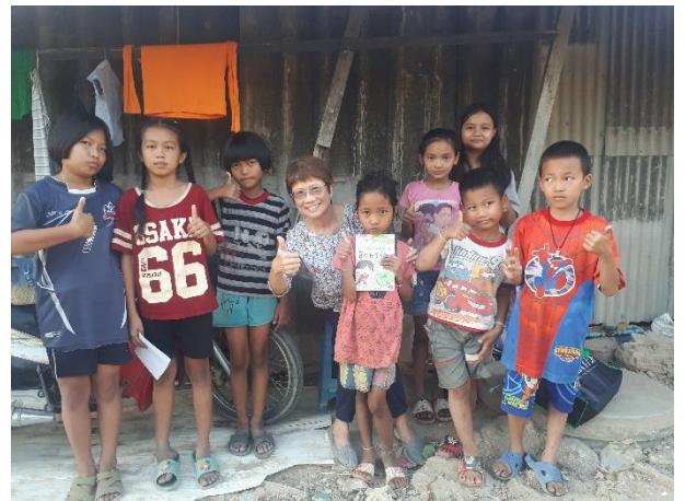
學生佈道團週五出隊