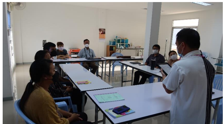
學生分享論文寫作及建議