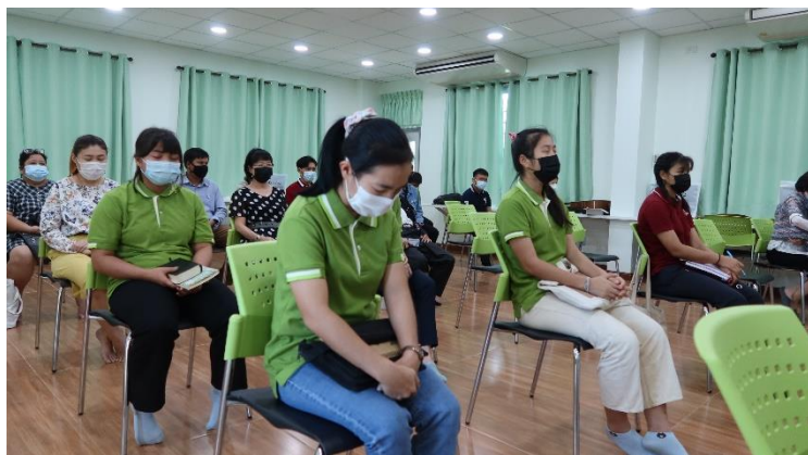
師生同心在早會敬拜與禱告